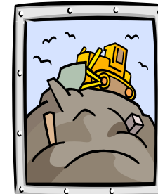
Basura pertenece en el vertedero, no en el patio del vecino.

Basura pertenece en el vertedero, no en el patio del vecino. Este y otros temas de mantenimiento de la comunidad son presentados en la Guía de Recursos de la Comunidad. Asimismo, descubrirá cómo usted puede resolver los problemas en relación con el control de roedores, hierba alta y las malezas, y almacenamiento de aparatos eléctricos a fuera de la casa, muebles antiguos y materiales de construcción. También encontrará información de lo que puede hacer acerca de vehículos comerciales y abandonados que están estacionado en su vecindario. Todas éstas situaciones pueden conducir a la desminuación de los valores de propiedad. Proteja su inversión, y resuelva éstos problemas cuando se produzcan.